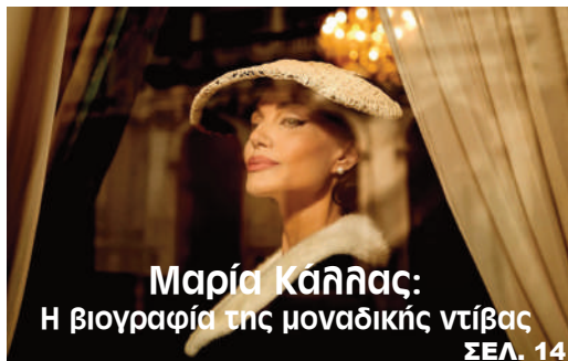
Μαρία Κάλλιας: Η βιογραφία της μοναδικής ντίβας ΣΕΛ. 14