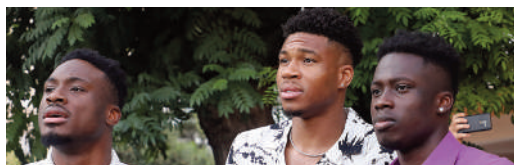
Στην οικογένεια Αντετοκούνμπο και την PREMIA Properties περνά το Village Cinema Ρέντη ΣΕΛ. 13